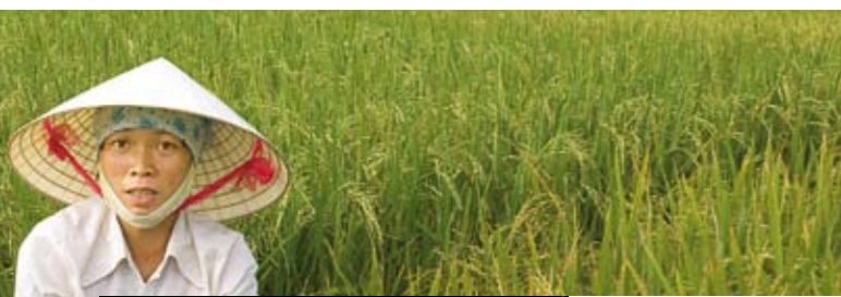
Reisanbau in Vietnam: Die Pflanze gibt besonders viel klimaschädliches Methan ab

Insgesamt gibt es 4 Schwerpunkte der Zusammenarbeit: