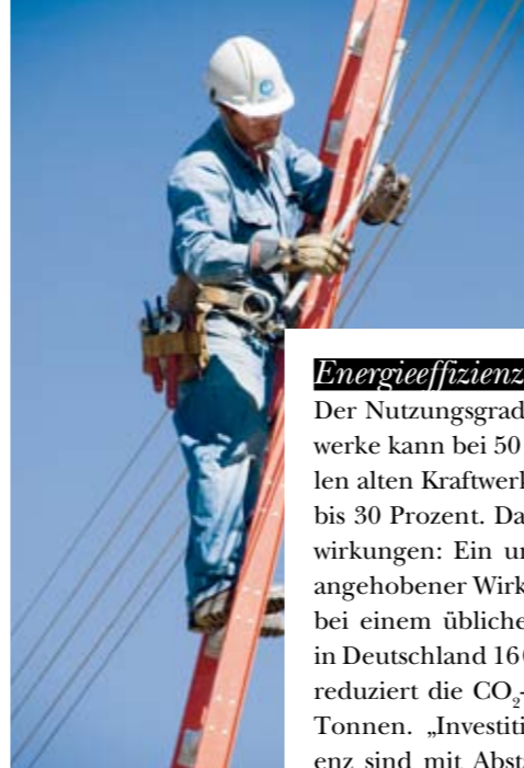
Mehr Effizienz: Instandsetzung einer Stromleitung in Bolivien

Die GTZ hat deshalb Methoden-Sourcebooks entwickelt. Mit Mitteln aus dem Umweltministerium fördert sie zum Beispiel in der Ukraine die Entwicklung zukunftsfähiger Verkehrssysteme. Auch in Südafrika engagiert sich Deutschland: Dort soll nach dem Beispiel von Bogotá, Kolumbien, ein Busverkehrssystem eingeführt werden, das wie ein U-Bahn-System funktioniert – zu viel geringeren Kosten. Abgetrennte Busspuren, klimatisierte Busse, definierte Haltestellen, Ticketkauf vor Antritt der Fahrt sorgen in Bogotá für einen schnellen, pünktlichen und bequemen Nahverkehr. Die Zahl der Fahrgäste steigt, während mit dem Individualverkehr auch die Emissionen von CO 2 zurückgehen.